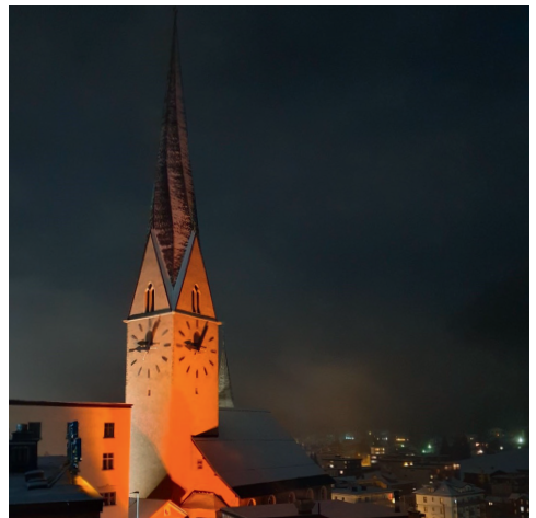
Kirche St. Johann